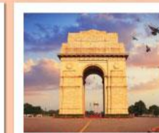
♥♥♥ India Gate