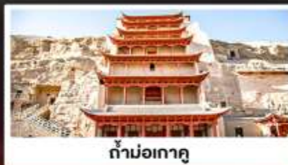
ถ้ำม่อเกาตู