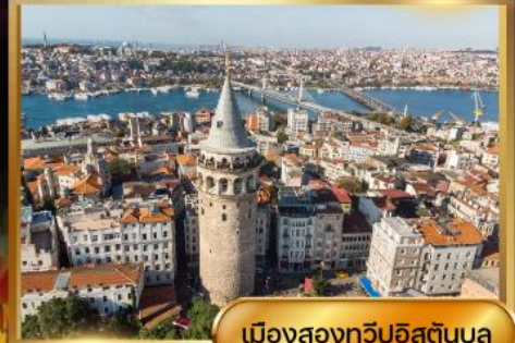
เมืองสองทวีปอิสตันบูล