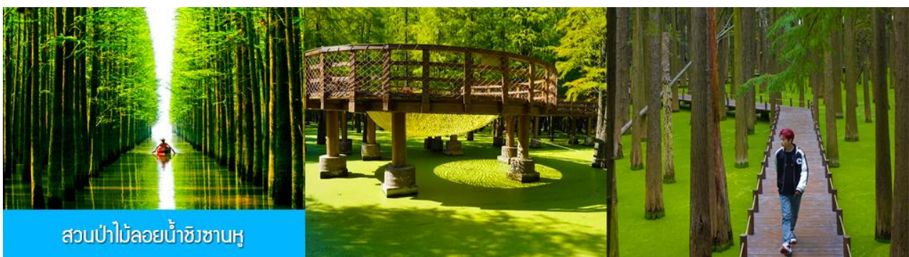
สวนป่าไผ่ลอยน้ำชิงชานหู

พักที่ PAIJING HOLIDAY HOTEL โรงแรมระดับ 4 ดาวท้องถิ่น หรือเทียบเท่า เมืองหวงซาน