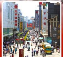
ช้อปปิ้งถนนคนเดินซุนซีลู่