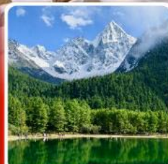
อุทยานปี้เฟิงโกว