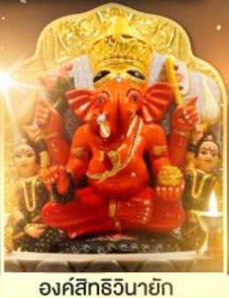
องค์สิทธีวินายก