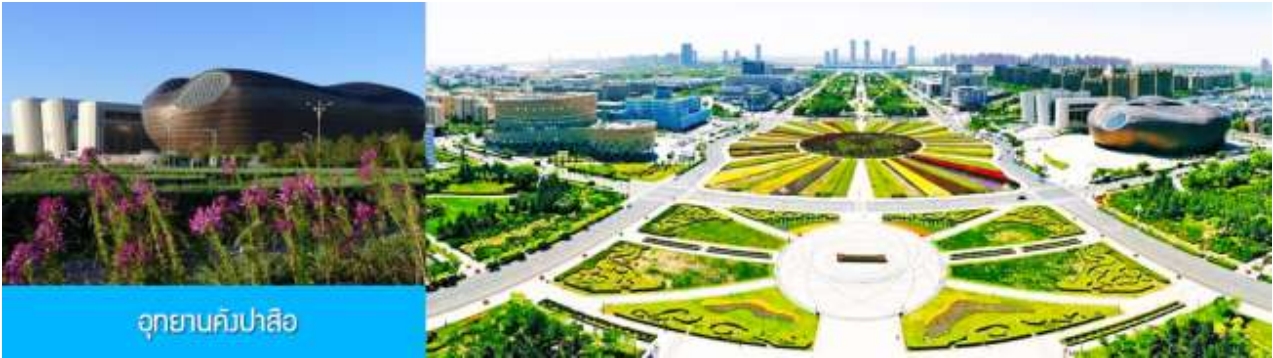
อุทยานคังปาสื่อ