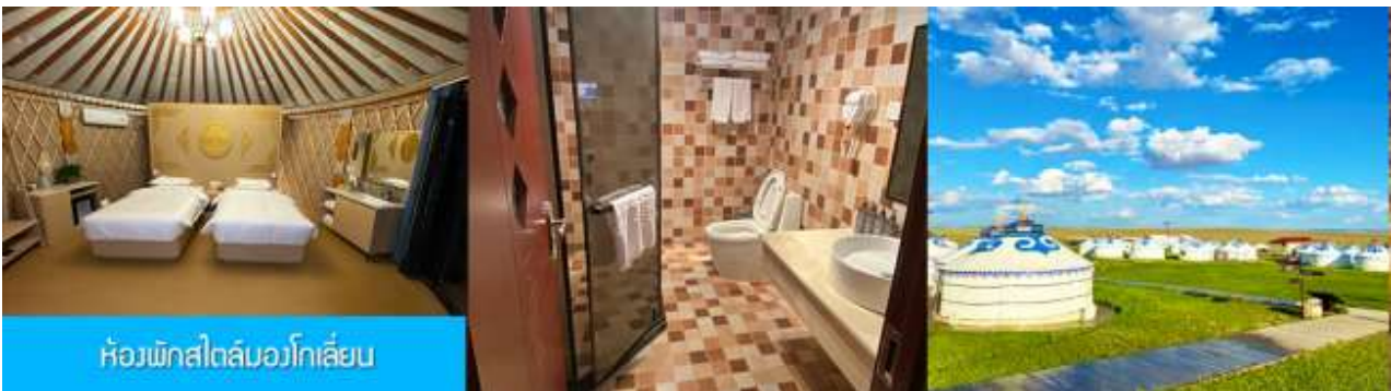
ห้องพักรีสไตล์มองโกล