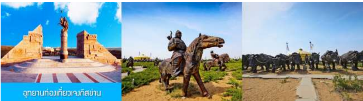
อุทยานก่อกว่เกี้ยวเวกิสฮาบ