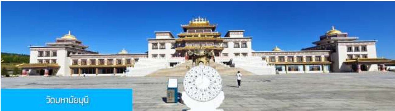
วัดมหาบุญนิ

หลังอาหารนำท่านเที่ยวชม สวนวัฒนธรรม หมงกู่หยวนหลิว 蒙古源流 เป็นอุทยานท่องเที่ยวเชิงประวัติศาสตร์และวัฒนธรรมระดับ 4A ของจีน ที่เป็นต้นกำเนิดของชนชาติและวัฒนธรรมมองโกล สะท้อนความเป็นจักรวรรดิที่ยิ่งใหญ่เมื่อ 700 ปีก่อน ชม ประตูงเทียน 崇天门 สุดมโหฬารที่แสดงถึงความยิ่งใหญ่ของจักรวรรดิมองโกล ชม พระราชวังหมิงจำลอง 大明殿 ที่สร้างขึ้นเพื่อใช้เป็นสถานที่ประกอบพิธีสำคัญของราชวงศ์หยวน ชม จัตุรัสเถิงเก้อหลี่ 腾格里广场 จัตุรัสกลางแจ้งขนาดใหญ่ที่ใช้ประกอบพิธีกรรมต่าง ๆ