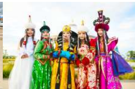
แต่งชุดพื้นเมืองบอโกล