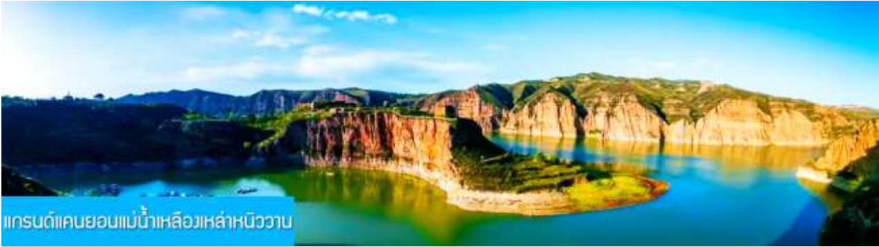
แกรนด์แคนยอนแม่น้ำเหลืองเหล่าหนิววาน

พักที่ DALATEQI SHNAGJING HOTEL โรงแรมระดับ 4 ดาวหรือเทียบเท่าในเมืองต้าลาเท่อ