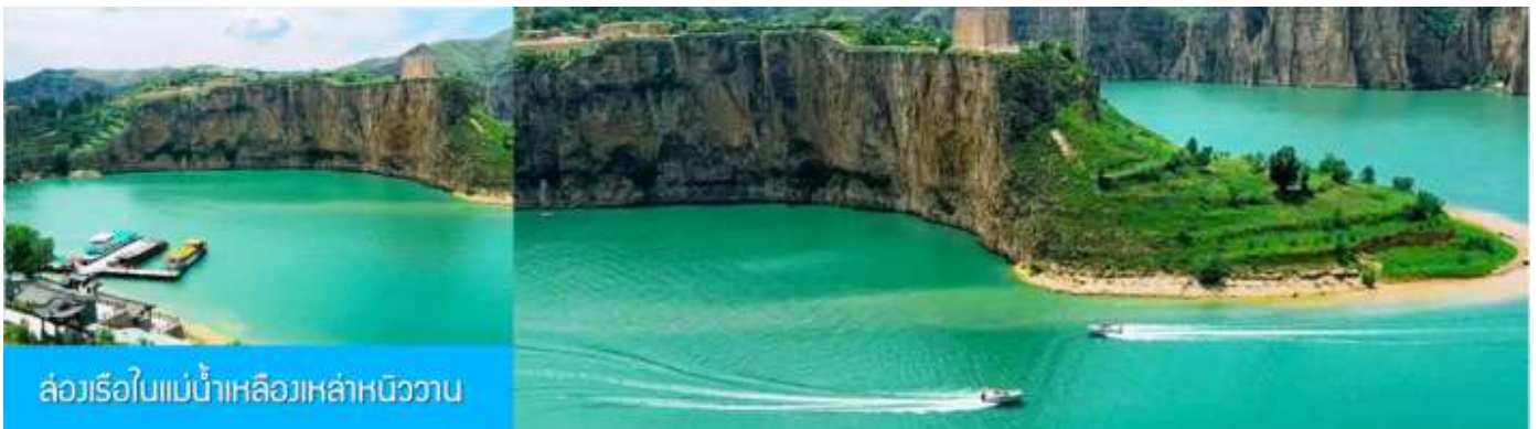
ล่องเรือใบแม่น้ำเหลืองเหล่าหนิววาน

รับประทานอาหารกลางวัน ณ ร้านอาหารระหว่างทาง (8)