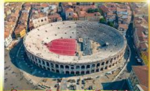
โรงละครโรมันกลางจัหวโรม่า