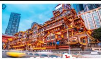
แสงเขยาดัง

อุทยานหลุมบ่อฟ้า - อุทยานเขานางฟ้า หงหยาดัง - นั่งรถไฟทะเลสาบ - อุทยานสี่ดรุณี ปี่ผิงโกว - สะพานหนานเฉียว