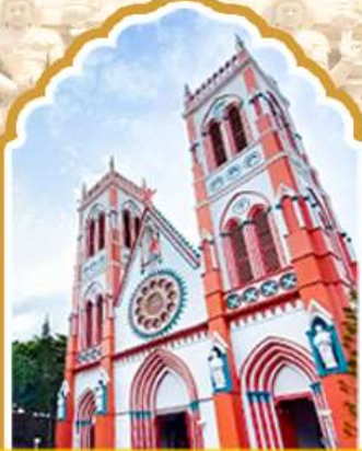
ปอนตีเซอร์