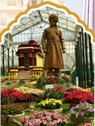
บังกาลอร์