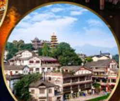
เมืองโบราณฉือจี้โข่ว