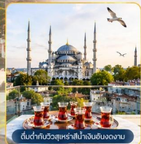
ต้นตักกับวิวสุหร่าน้ำเงินอันงดงาม

พิเศษ...สุดๆ! นำท่าน ขึ้นสู่จุดเช็คอินแห่งใหม่ Seven Hills Café ซึ่งเป็นสถานที่ยอดนิยมขณะนี้..บนชั้นดาดฟ้า ของโรงแรมเซเวนฮิลล์ส ท่านจะได้ถ่ายรูปกับวิวมุมต่าง ๆ ช่องแคบบอสฟอรัส, สุหร่าน้ำเงินและสุเหร่าฮาเจียโซเฟีย พร้อม ให้อาหาร กับเหล่านกนางนวลที่จะบินมารับอาหารจากท่าน **ขออนุญาตท่านที่ชื่นชมความงามวิวกวร้ายล้ำ ช่วยอุดหนุนเครื่องดื่ม ชา กาแฟ ซอฟดริงค์ อื่นๆ ตามต้องการ