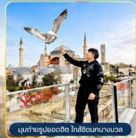
มุขถ่ายรูปรยออดิต ใกล้เคียงนางนวล