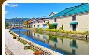
คลองไอตารุ