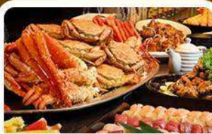
บุฟเฟ่ต์ซาซิมิ+ชาปู 3 ชนิด