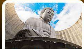
เนินเขาแห่งพระพุทธรเจ้า