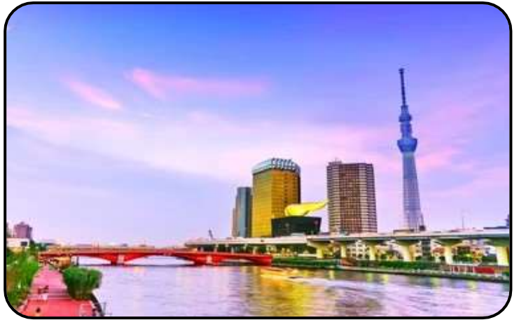
แม่น้ำสุมิตะ

สักการะ วัดมัตสึจิยามะโชเต็น หรือ “วัดหัวไชเท้า” ซึ่งเป็นวัดเก่าแก่ในย่านอาซากุสะ เป็นวัดเก่าแก่ในย่านอาซากุสะ กรุงโตเกียว ตั้งอยู่บนเนินเขาเล็ก ๆ ริมแม่น้ำสุมิตะ จุดเด่นคือเป็นวัดที่ขึ้นชื่อเรื่อง “ขอพรด้านการเงิน” โชคลาภ และความสำเร็จในธุรกิจ ส่วนไฮไลต์สำคัญของวัดนี้คือ ไคคอน หรือหัวไชเท้า สัญลักษณ์ศักดิ์สิทธิ์ คนที่นี้เชื่อว่าไคคอนช่วย “ชำระล้างสิ่งไม่ดี” และนำโชคลาภเข้ามา นักท่องเที่ยวมักนำไคคอนไปถวายเพื่อขอพร