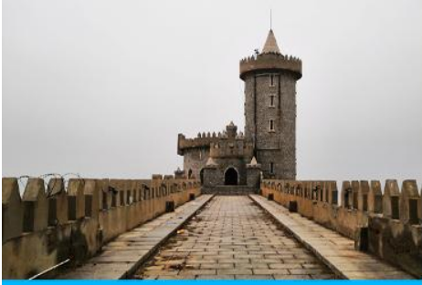
คาเฟ่อีสตว