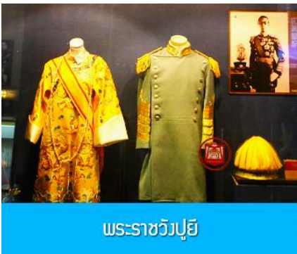
พระราชวังปูยี

หลังอาหารนำท่านเช็คเอาท์ออกจากโรงแรมที่พักแล้วเดินทางสู่ เมืองฉางชุน 长春市 (ระยะทาง 120 กม.ใช้เวลาเดินทางราว 1 ชั่วโมงครึ่ง)