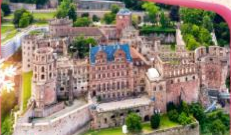
ปราสาทไชลอนเบิร์ก