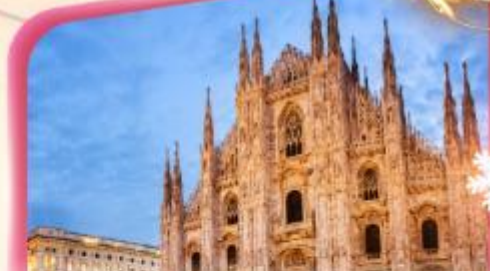
คูโอโมมิลาโน