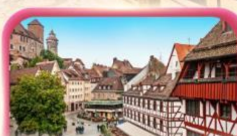
สัมผัสเมืองเก่าบูเรมเบิร์ก