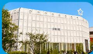
บูรักลินเกาหลี