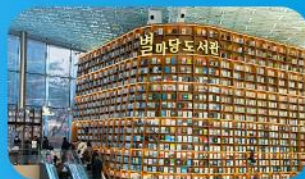
ห้องสมุดสตาร์ฟิลา