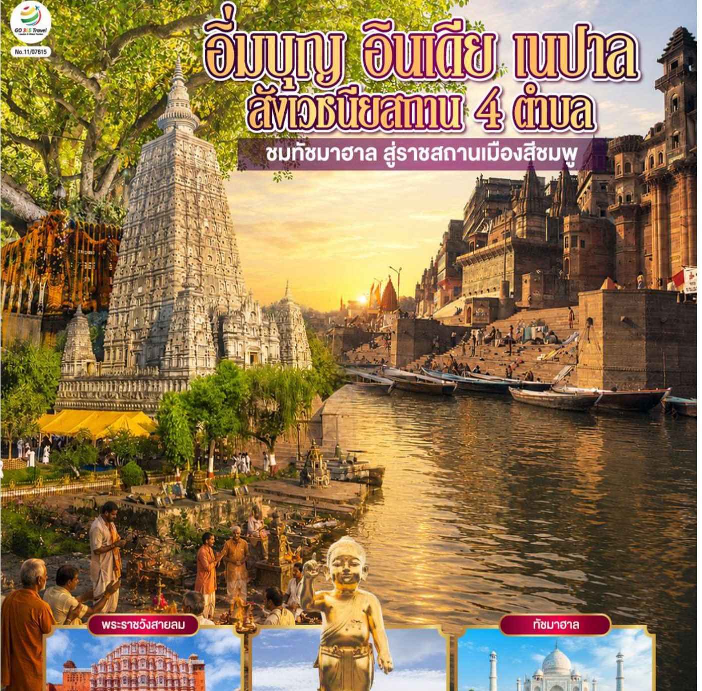
พระราชวังสายลม