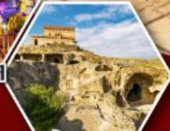
เมืองเก่าทบิลิส